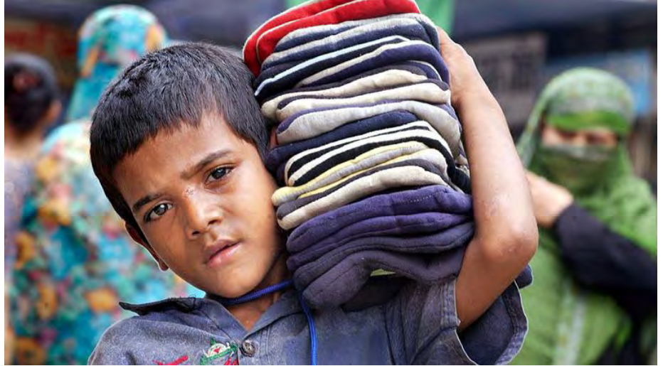
Un enfant vend des vêtements au Bangladesh

Bien que l'école soit obligatoire, les enfants-travailleurs, les enfants handicapés n'y ont, le plus souvent, pas accès.