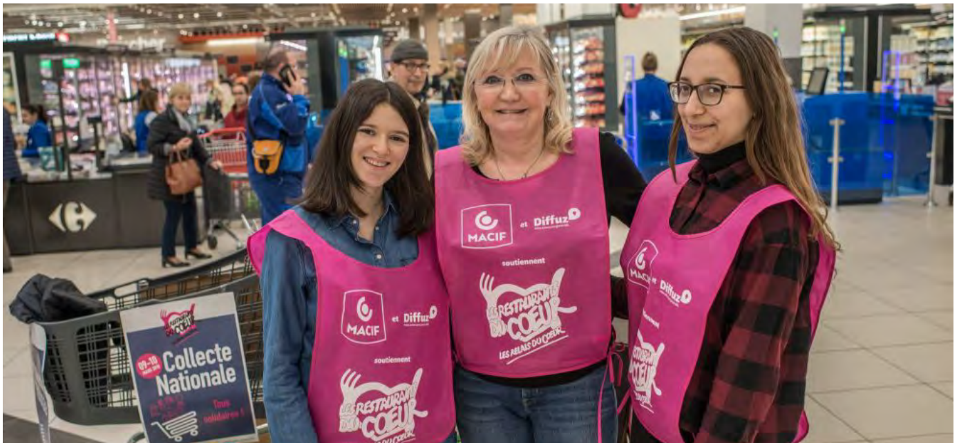
Bénévoles des Restaurants du Cœur lors d'une collecte nationale