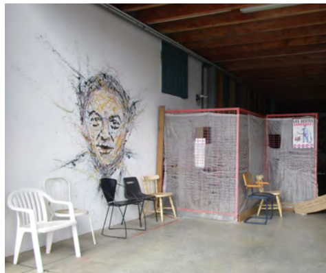
Fresque représentant Coluche (Restos du Cœur de Besançon)