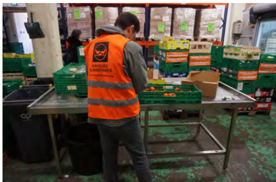
Tri des denrées collectées