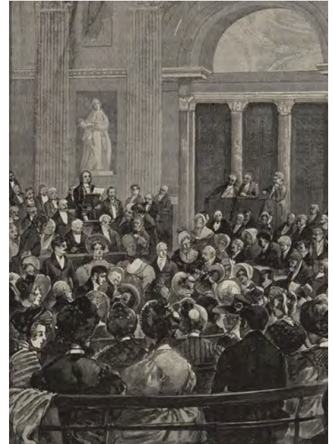
Discours de Victor Hugo avant l'exil - Paris Musées