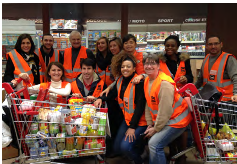
Bénévoles de la Banque alimentaire lors d'une collecte nationale