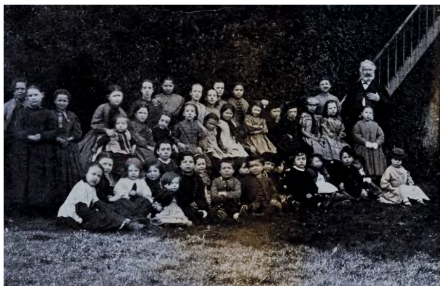
Victor Hugo et 40 orphelins de Guernesey - Maison Victor Hugo de Villequier

Victor Hugo mettra en pratique ses idées en instaurant les dîners des enfants pauvres dans sa maison de Guernesey à partir de 1862, année de parution des Misérables .