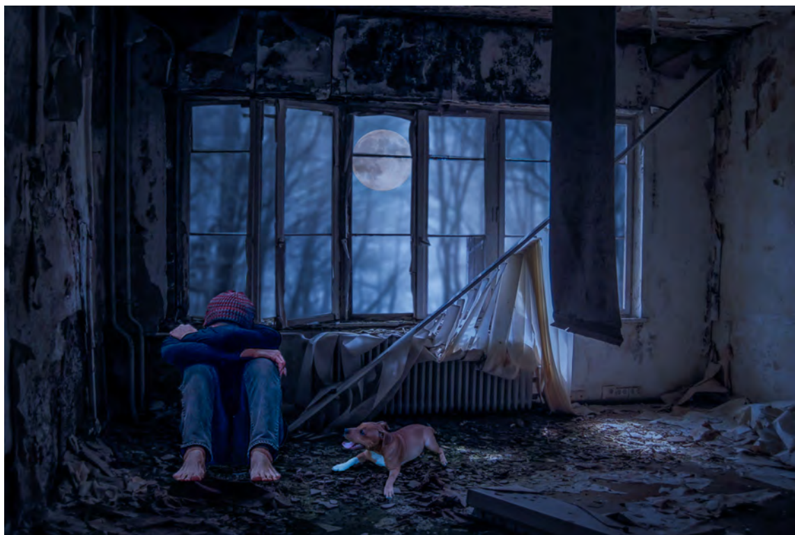
Image de la pauvreté