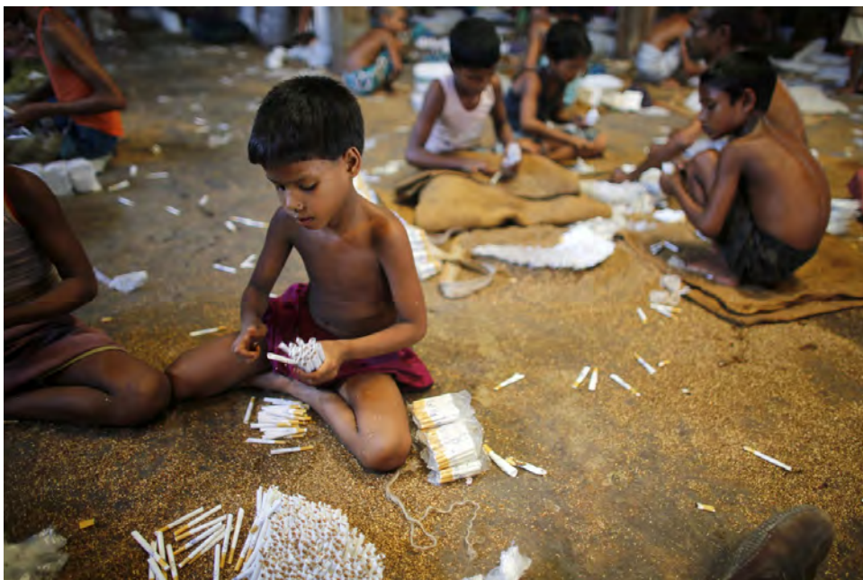
Des enfants remplissent manuellement des cigarettes vides