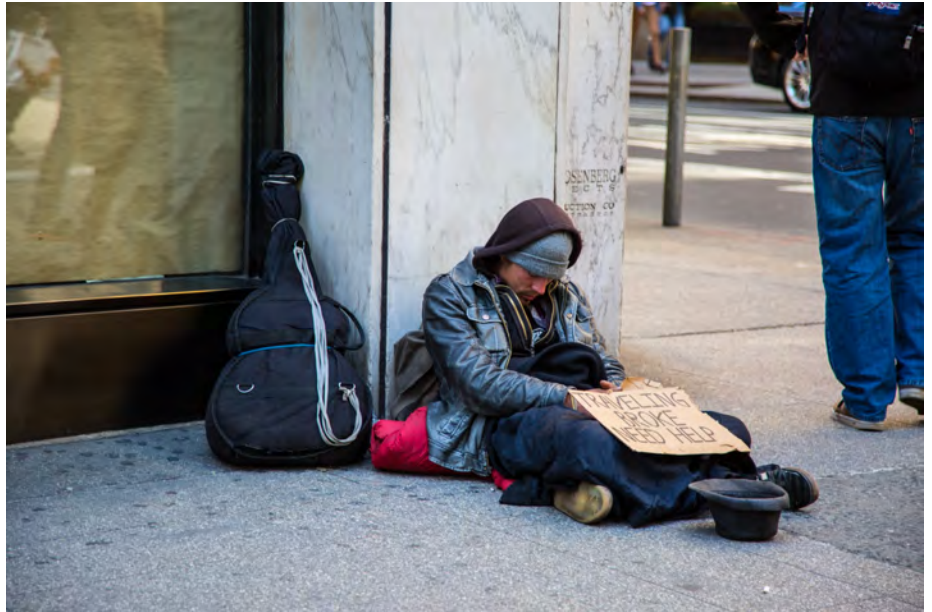
Une personne sans domicile fixe